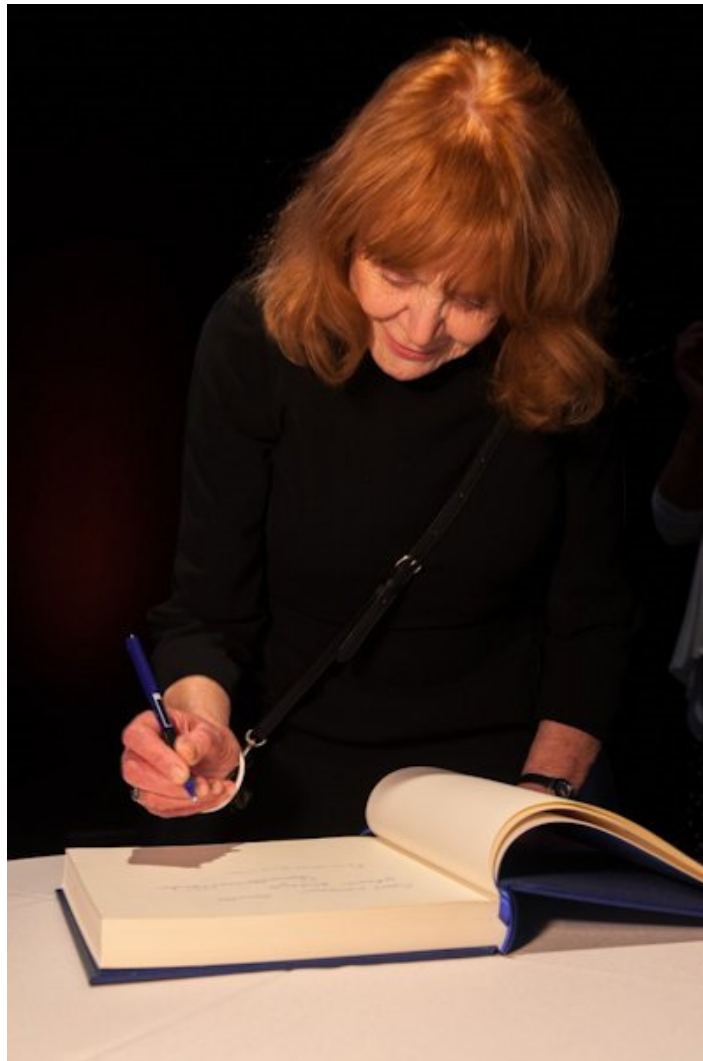
Françoise Sullivan signe le Livre d'or de l'Ordre des arts et des lettres du Québec, le 23 mars 2015, à Montréal.