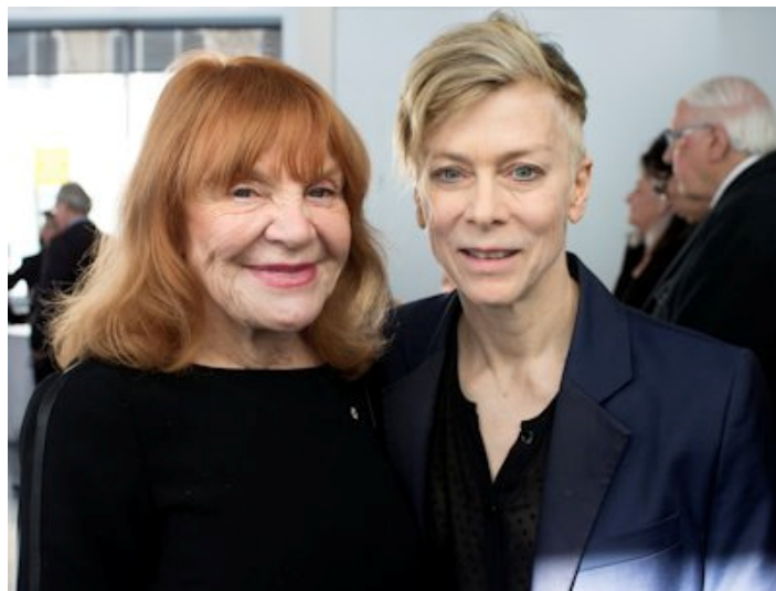
Rencontre entre deux grandes artistes qui ont incarné l'avant-garde de la danse au Québec à quelques décennies d'intervalle, Françoise Sullivan et Louise Lecavalier , lors de la remise de l'Ordre des arts et des lettres du Québec, le 23 mars 2015. Toutes deux sont désormais Compagnes des arts et des lettres du