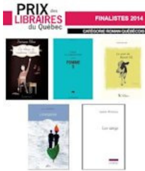
Finalistes de la catégorie "Roman québécois" du Prix des libraires du Québec