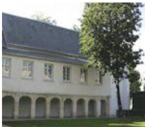
Le Couvent des Récollets, à Paris

Trois nouvelles structures d'accueil se sont ajoutées aux Résidences de recherche et de création en arts numériques en France offertes aux artistes professionnels du Québec. En plus du CUBE et de la Gaîté Lyrique, à Paris, il sera possible de profiter des installations du Centre des arts d'Enghien-les-Bains, du centre ZINC, à Marseille, et du centre européen de création et de production en arts numériques Ars Numerica, rattaché à MA Scène nationale, à Montbéliard. Ces résidences découlent d'une entente de partenariat entre le CALQ et l'Institut français. Les artistes qui comptent au moins deux ans de pratique professionnelle en arts numériques ont jusqu'au 17 février 2014 pour déposer leur candidature.