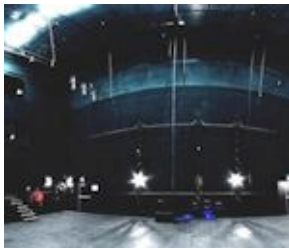
La scène numérique d'Ars Numerica.