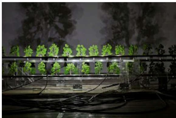
Imbrication (machine à réduire le temps).