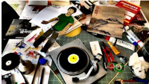
La table de travail d'Antoine Laprise au Studio du Québec à Tokyo.

Rappelons que la prochaine date limite d'inscription pour les Échanges d'artistes et d'ateliers-résidences Québec - Mexique est le 1 er avril 2014 .