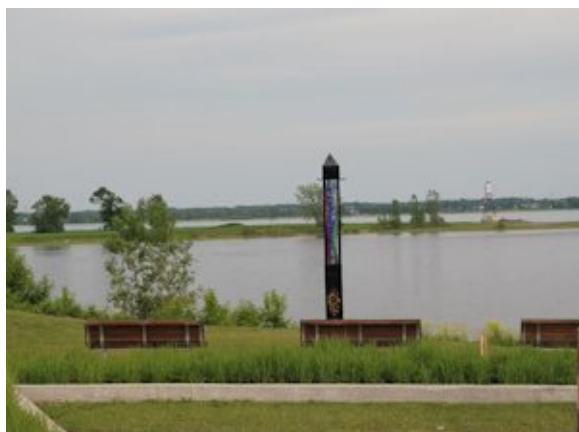
Lumière d'histoire , de l'artiste-verrier Stephen Pon.

Lumière d'histoire rappelle l'importance d'un ancien amer servant à la navigation. Jadis arrêt important pour la navigation entre Montréal et Québec, le quai de la ville fut le berceau du développement de la région. L'obélisque se veut le rappel d'un phare et peut être vu à partir du fleuve ou du parc.