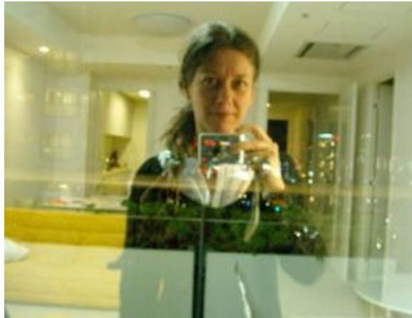
Autoportrait de Sylvie Cotton

L'artiste interdisciplinaire, auteure et commissaire Sylvie Cotton , également membre du C.A. du CALQ, animera un atelier d'une durée de trois jours sur le thème "Mes tabous en création", dans le cadre des formations proposées par le Regroupement des arts interdisciplinaires du Québec (RAIQ).