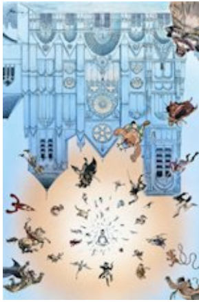
Affiche du festival BulleBerry 2014