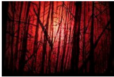
Forêt noire , de Chantal Harvey

Côte-Nord à Sept-Îles, le samedi 15 novembre 2014.