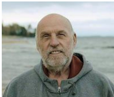
>>> Vidéo consacrée à l'écrivain Yvon Paré sur La Fabrique culturelle.