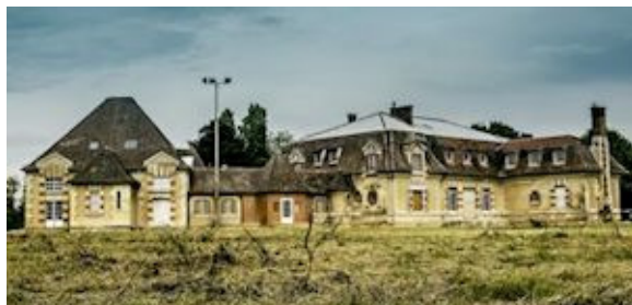
Le Château Éphémère.