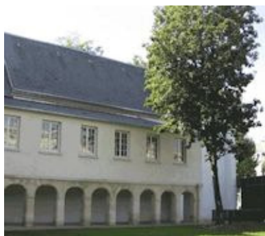
Le Couvent des Récollets, à Paris

artistes français sont accueillis à la Fonderie Darling. Cet échange est possible grâce à une entente de réciprocité entre le CALQ et le Ministère de la Culture et de la Communication du gouvernement français.