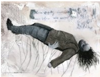
Une des planches de Ludwig de Christian Quesnel.