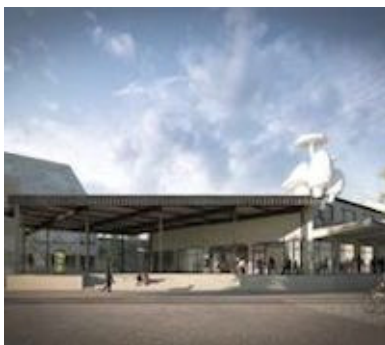
L'Atelier Mondial, à Bâle