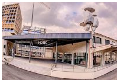
La Maison des arts électroniques de Bâle

Les Résidences d'artistes et d'écrivains québécois au Tokyo Wonder Site s'adressent aux artistes et aux écrivains comptant plus de cinq ans de pratique professionnelle en arts multidisciplinaires, arts numériques, arts visuels, chanson, cinéma et vidéo, danse, littérature et conte, métiers d'art, musique, théâtre ou recherche architecturale. La date limite d'inscription est le 6 avril 2015 .