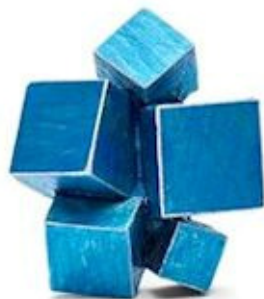
Insigne de l'OALQ, réalisé par Christine Dwane.

Voilà deux réalisations concrètes qui témoignent à nouveau de notre détermination à placer le soutien à la création artistique et littéraire au coeur de notre action.