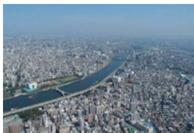
L'arrondissement Sumida, quartier du Tokyo Wonder Site

Les Résidences d'artistes et d'écrivains québécois au Tokyo Wonder Site s'adressent aux artistes et aux écrivains comptant plus de cinq ans de pratique professionnelle en arts multidisciplinaires, arts numériques, arts visuels, chanson, cinéma et vidéo, danse, littérature et conte, métiers d'art, musique, théâtre ou recherche architecturale. La date limite d'inscription est le 6 avril 2015 .