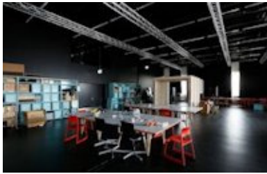
Le Critical Media Lab de l'ixdm, à Bâle

Selon ses besoins, l'artiste sélectionné aura accès aux équipements la Maison des arts électroniques de Bâle (HeK), un centre pluridisciplinaire ouvert aux croisements entre les arts (arts visuels, musique, théâtre, danse, performance et design), les nouveaux médias et la technologie, ou à ceux de l'Institute of Experimental Design and Media Cultures (ixdm) où se développent des projets de recherche à la croisée du design, des arts médiatiques, de la science et la de la technologie. En contrepartie, le CALQ accueillera un artiste bâlois ou français à Montréal, à la Société des Arts Technologiques.