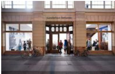
Künstlerhaus Bethanien, à Berlin

Le CALQ a conclu une entente de partenariat avec le centre HELLERAU – Europäisches Zentrum der Künste Dresden axé sur l'échange de résidences de création en musiques nouvelles. Ainsi, un compositeur québécois pourra séjourner deux mois à Dresden à HELLERAU, l'un des plus importants centres interdisciplinaires d'art contemporain d'Allemagne. En contrepartie, un compositeur allemand sera accueilli au Québec, à Montréal, avec la participation du Goethe-Institut Montréal et Le Vivier - Carrefour des musiques nouvelles. Les compositeurs québécois ont jusqu'au 1 er mai 2015 pour poser leur candidature. >>> Détails