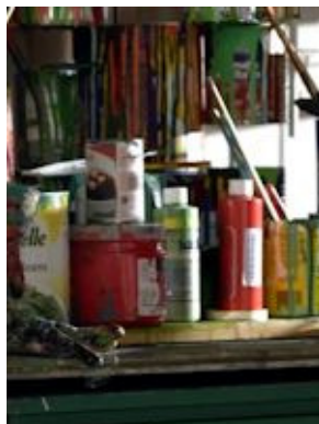
Extrait de la vidéo BGL - Canadassimo