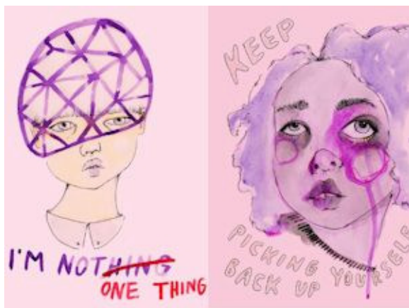
Dessins de Natalie Finkelstein . Source: site Web de l'artiste