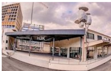
La Maison des arts électroniques, à Bâle