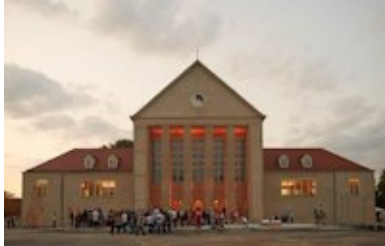
Le centre HELLERAU à Dresden

La période d'inscription à ce programme d'échange a été exceptionnellement prolongée jusqu'au 5 juin 2015 .