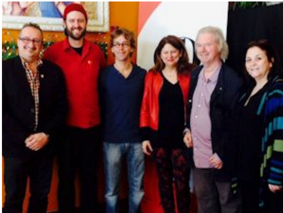
Agrandir la photo