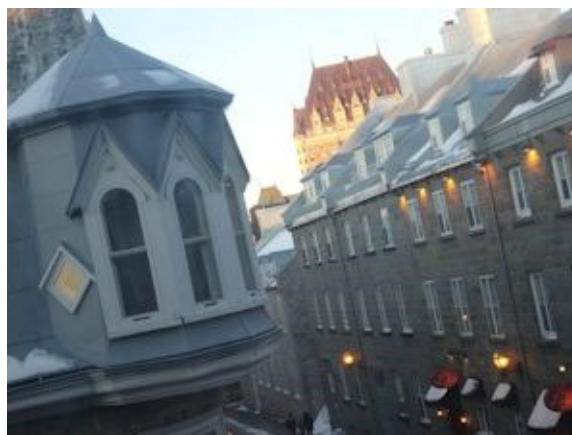
Vue de la table de travail de Jean-Luc Cornette , à Québec.