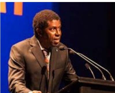
Discours de remerciements de Dany Laferrière .

L' Ordre des arts et des lettres du Québec (OALQ) vise à honorer des personnes ayant contribué de manière remarquable, par leur engagement et leur dévouement, au développement, à la promotion ou au rayonnement des arts et des lettres du Québec. Il n'est accompagné d'aucune récompense financière mais est symbolisé par un insigne, qui a été remis au cours des derniers mois à trois créateurs n'ayant pu assister à la cérémonie inaugurale du 23 mars 2015.