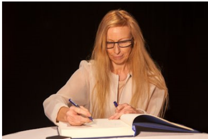
Marie Chouinard signe le Livre d'or de l'Ordre des arts et des lettres du Québec, le 23 mars 2015, à Montréal.