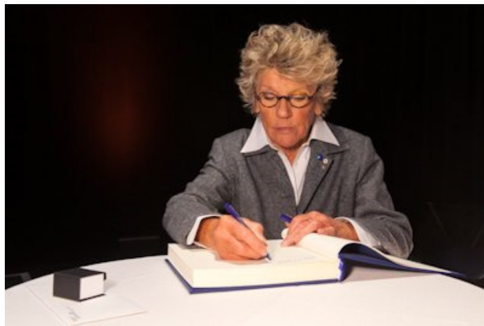
Clémence DesRochers signe le Livre d'or de l'Ordre des arts et des lettres du Québec, le 23 mars 2015, à Montréal.