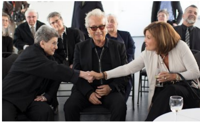
Phyllis Lambert , Luc Plamondon et Liza Frulla lors de la remise de l'Ordre des arts et des lettres du Québec, le 23 mars 2015, à Montréal.