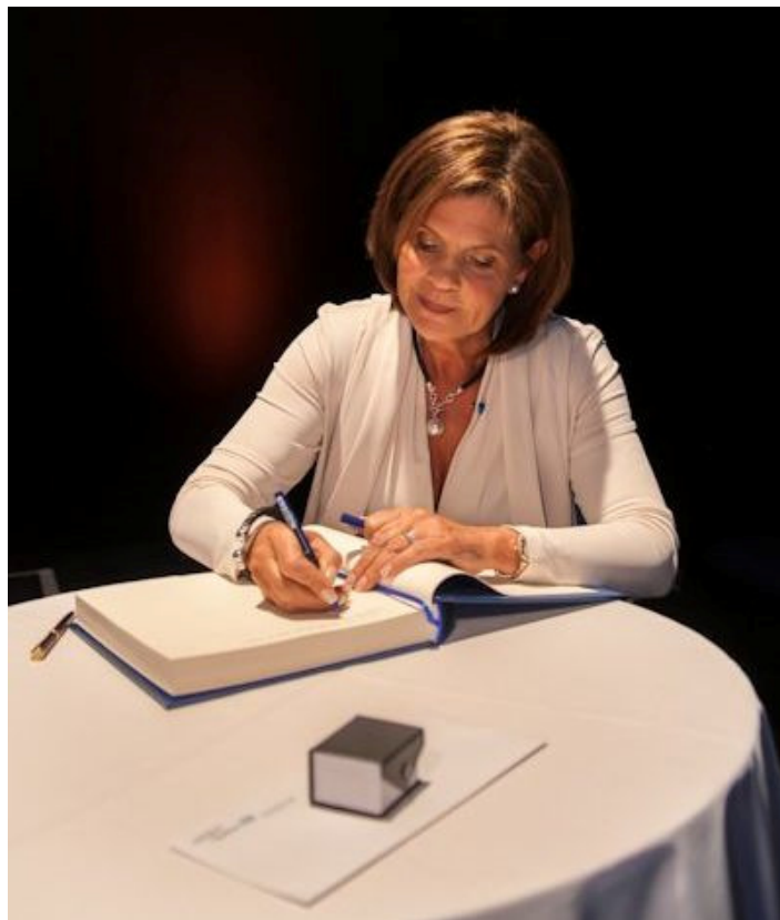
Liza Frulla signe le Livre d'or de l'Ordre des arts et des lettres du Québec, le 23 mars 2015, à Montréal.