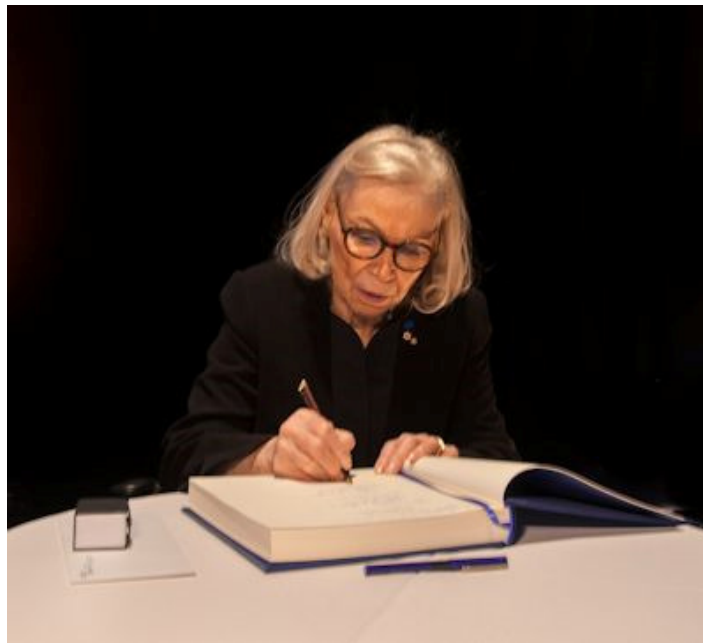
Monique Mercure signe le Livre d'or de l'Ordre des arts et des lettres du Québec, le 23 mars 2015, à Montréal.