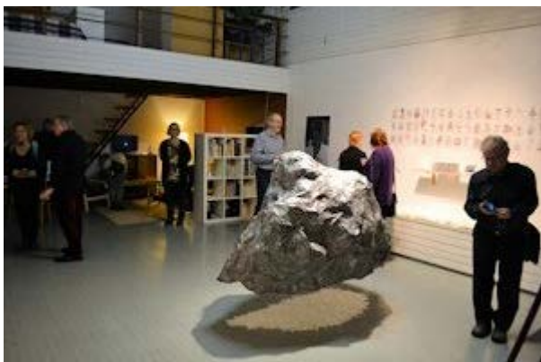
Vue partielle de l'exposition Onde de choc de Suzanne FerlandL à Tapiola en Finlande.