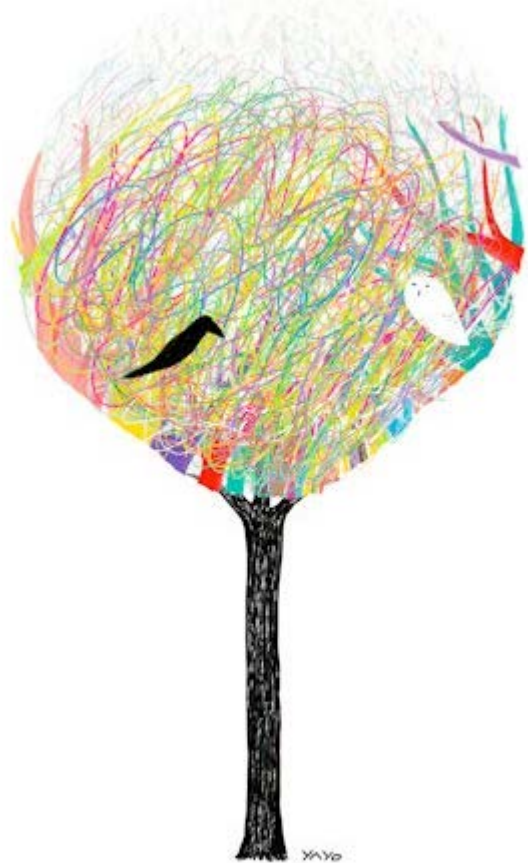
Gracieuseté de l'artiste Yayo

Au nom du conseil d'administration, je remercie toutes les personnes qui ont contribué à la préparation de ce plan. Il faut maintenant le réaliser et le faire vivre au quotidien, ensemble.