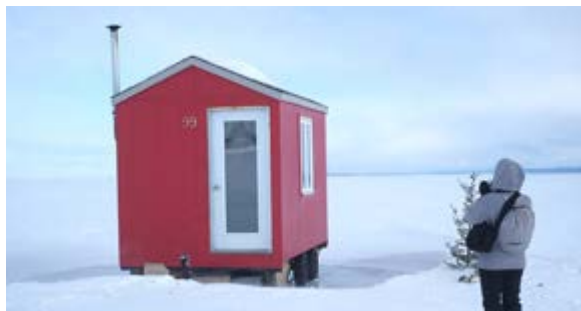
Extrait de Quartiers d'hiver de Lucie Jean

Le projet photo-vidéo d' Eva Quintas , La Fusion des horizons , a été réalisé à l'été 2015, dans le cadre des Échanges d'artistes et d'ateliers-résidences Québec - Colombie. Il est présenté, du 9 au 13 mai, au Festival international de la Imagen Manizales, l'un des plus importants festivals spécialisés en arts médiatiques de l'Amérique latine.