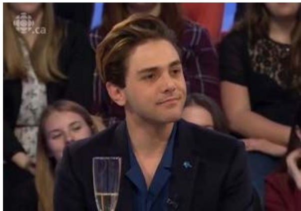
Xavier Dolan portant l'insigne de l' O.A.L.Q. à Tout le monde en parle .