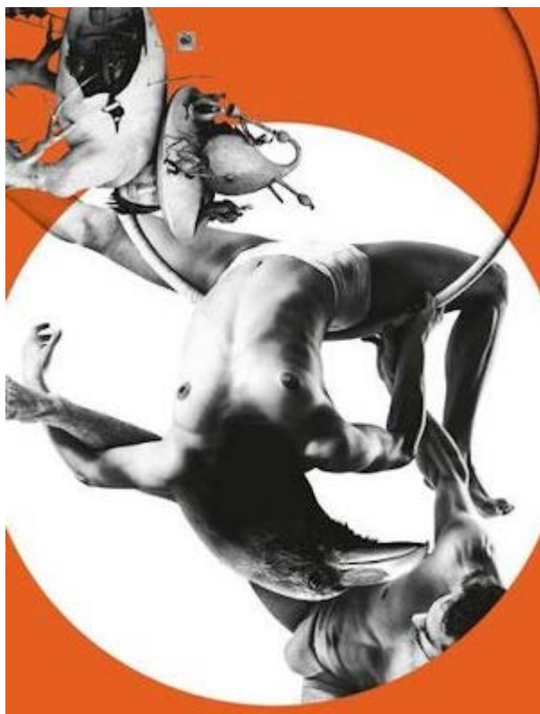
Bosch Dreams sur le site des 7 doigts de la main